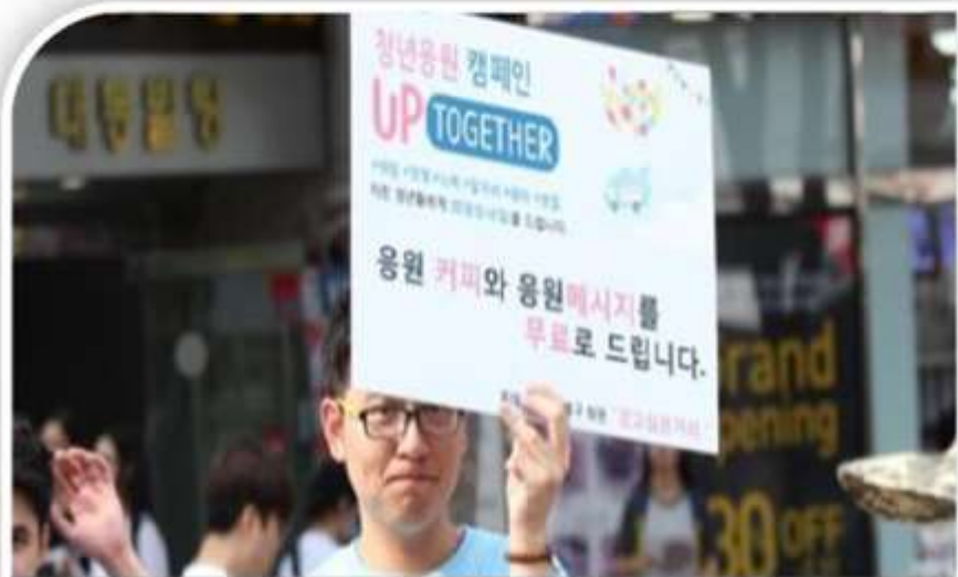
“청년 실업해소를 위한 지원사업”

청년 실업 해소를 위해 다양한 실험과 대안 모색의 장을 마련하고 청년 당사자 조직의 활동지원을 통해 네트워크와 지원 인프라를 구축합니다. 또한 혁신적인 아이디어와 창의성을 바탕으로 만들어진 소셜벤처와 민간창업을 지원합니다.