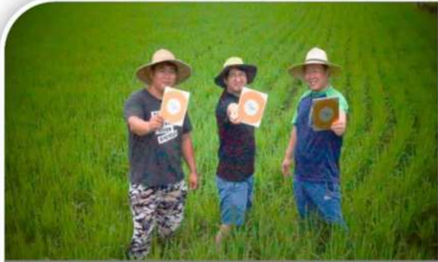
“시민모금을 통한 새로운 일자리 창출”

일자리 창출 및 실업빈곤가정 지원을 위한 시민모금을 진행하고 있으며, 모금된 기부금은 경제사회적 위기에 처한 실직, 빈곤가정 아동 및 청소년, 실업청년, 경력단절여성 일자리 지원, 시니어 일자리 창출 등에 사용됩니다.