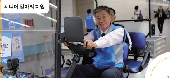
시니어 일자리 지원